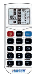
960005 MANDO DE CONTROL REMOTO HD05R COMANDO DE CONTROLE REMOTO HD05R